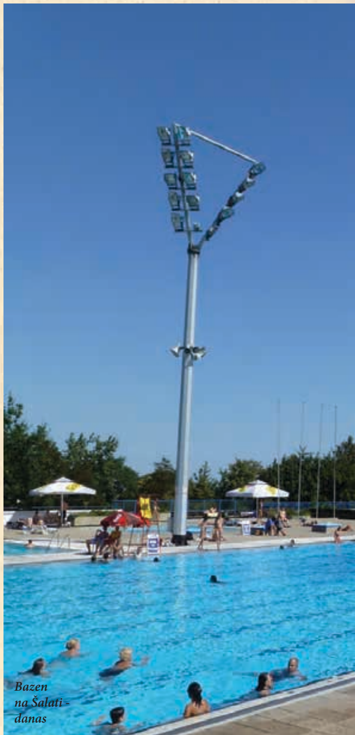
Bazen na Šalati - danas

Nakon učestalih poplava, izlivanja Save, Jugoslavenki plivački savez i Hrvatski veslački klub 1924. godine predlažu gradnju novog gradskog kupališta s bazenom veličine 3000- 5000 m 2 s popratnom infrastrukturom. Međutim, tadašnji zagrebački gradski oci nisu imali slu-