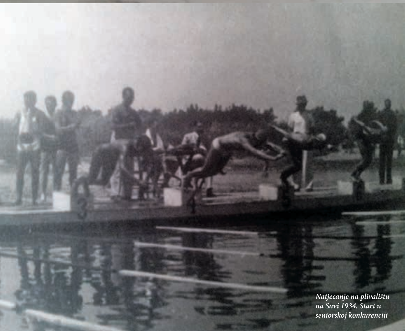
Natjecanje na plivalištu na Savi 1934. Start u seniorskoj konkurenciji