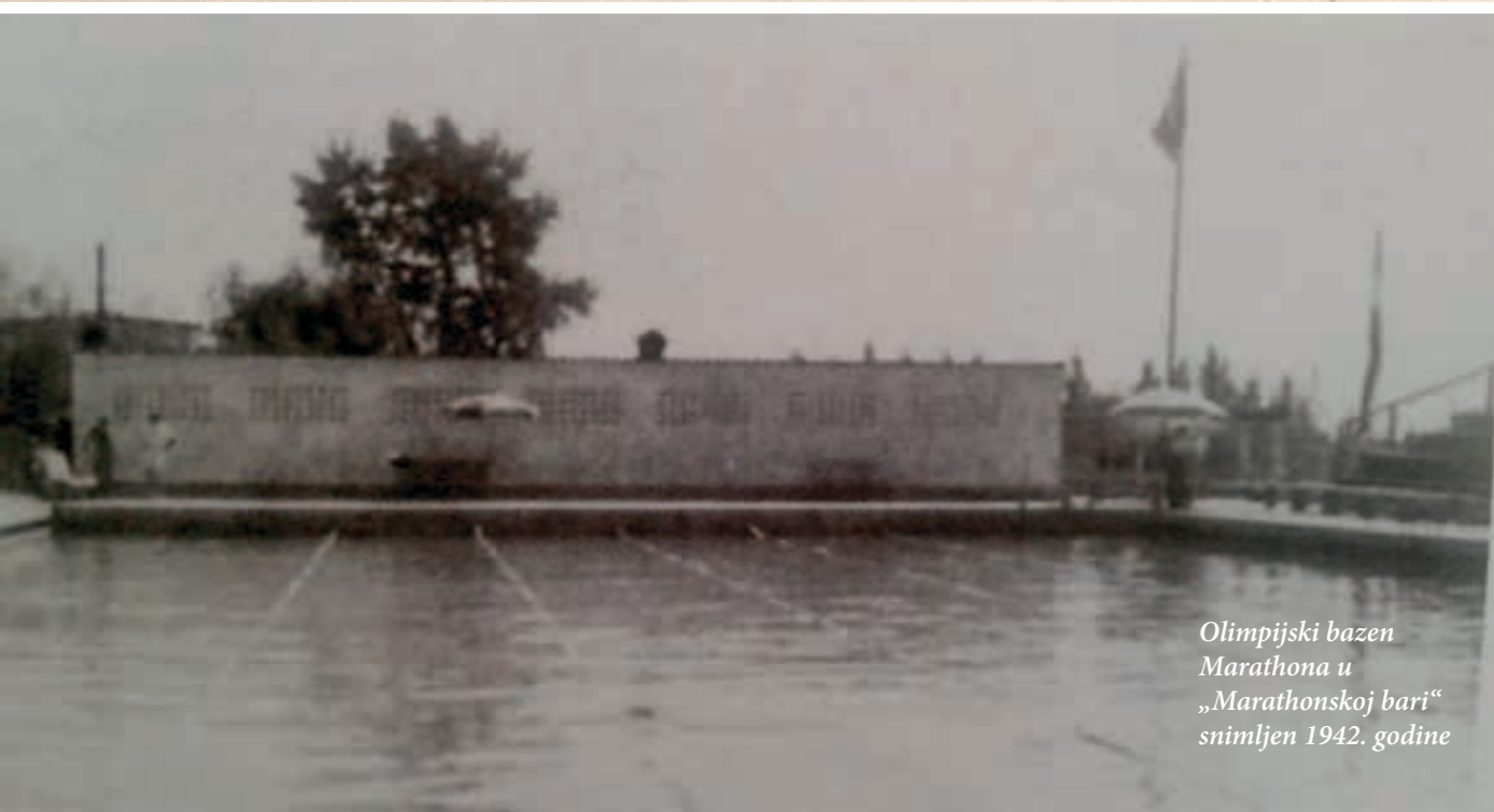
Olimpijski bazen Marathona u „Marathonskoj bari“ snimljen 1942. godine