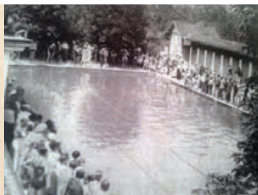
Hidropatsko plivalište u Samoboru